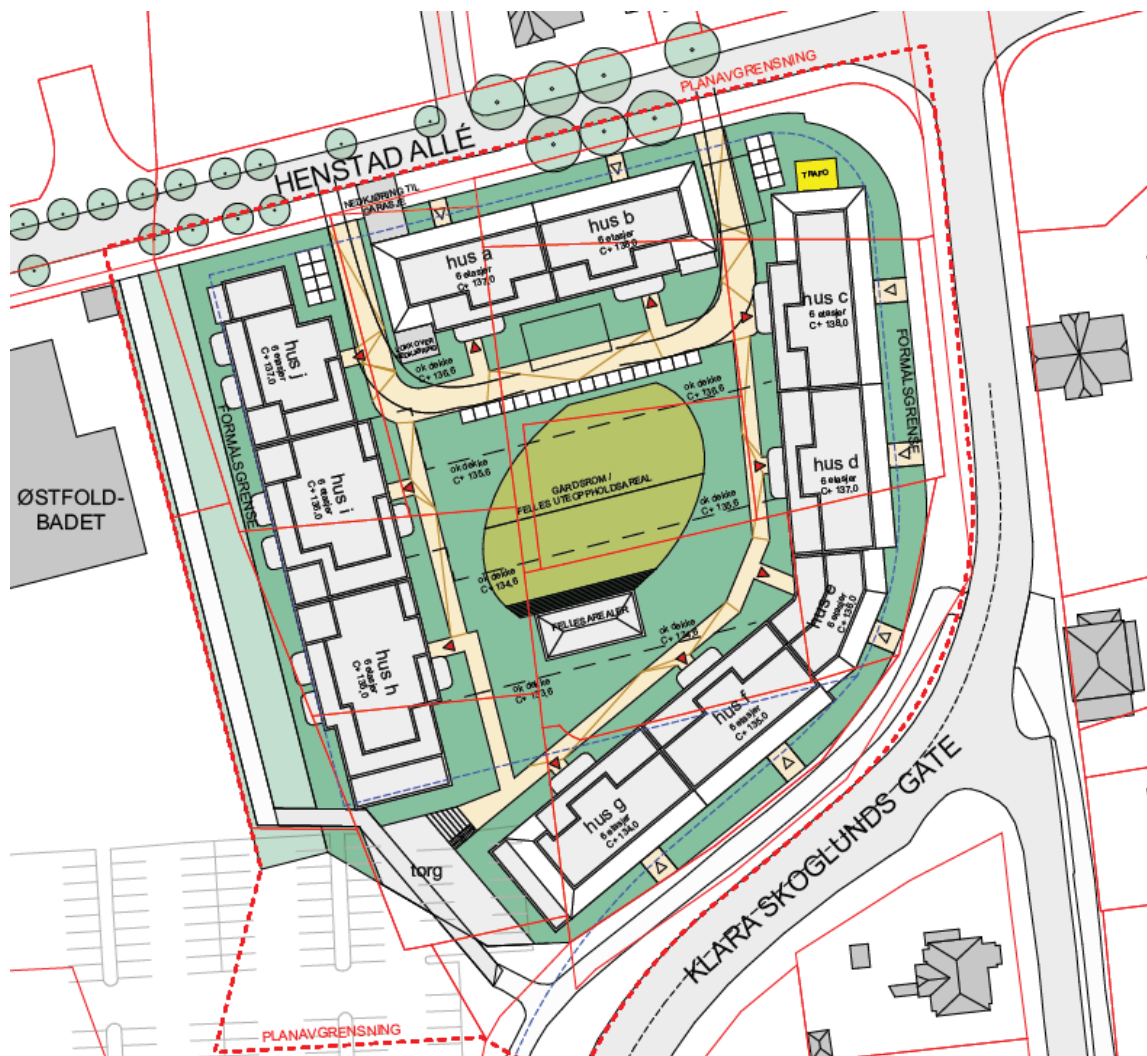
Figur 2: Utklipp fra situasjonsplanen som viser byggenes plassering på tomte. Nye bygg er på seks etasjer.