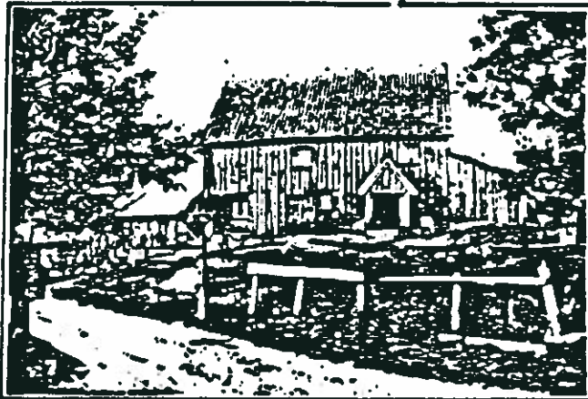
Hovin Nordre. Lå ved gamle Kongeval. Skjenkebevilgning. Brenneriet lå ved Smalelva. Skjenkingen foregikk gjennom en glugge i vegg t.v. Hovedbygning oppført i 1770.

Hovedbygning ble oppført i 1770, restaurert i 1925-37. Bygningen er gammel med utseende etter datidens byggeskikk.