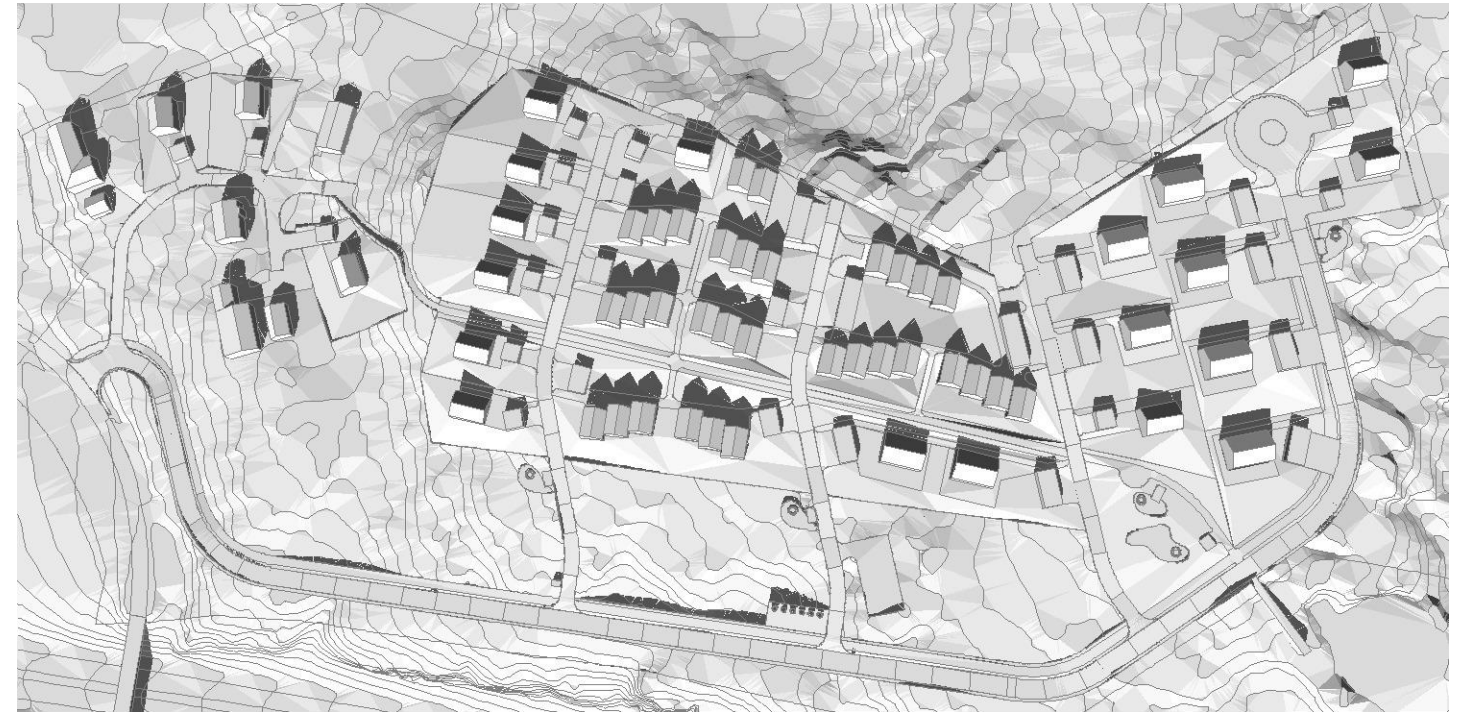
21. mars 13:00