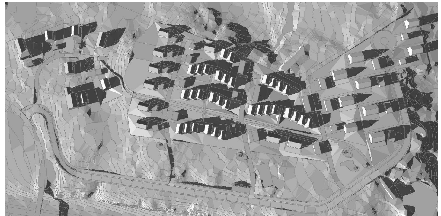
21. mars 18:30

Copyright Arkama as - fillopath: C:\Users\Monika.Dodava\Desktop\2020-02-19_1903_Regulering_Hærland_MD.pjn