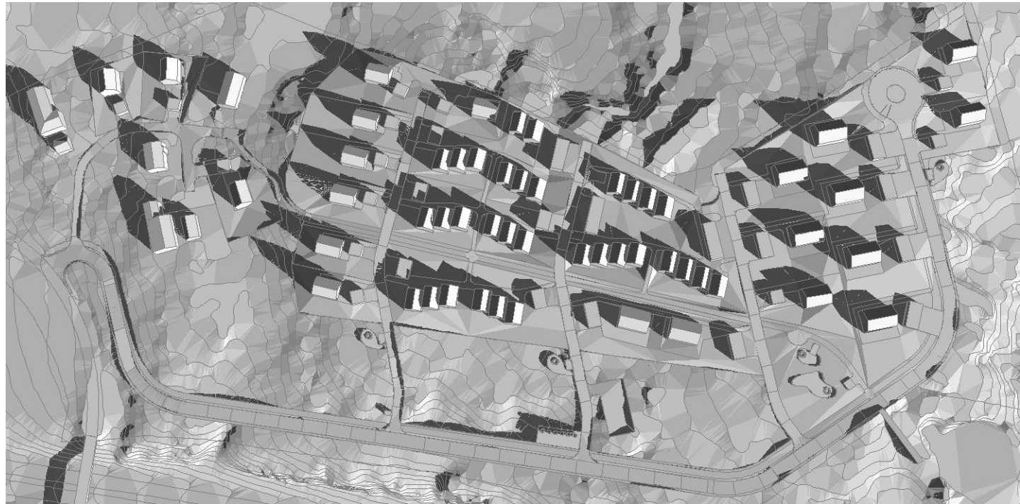
21. mars 09:00