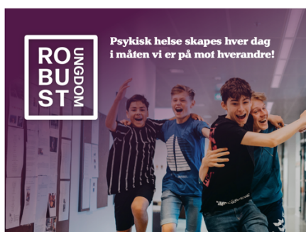
BANNER, 2 x 1,5 meter

Tiltak: En sjekkliste for å styrke videreføring og drift er under utarbeidelse.