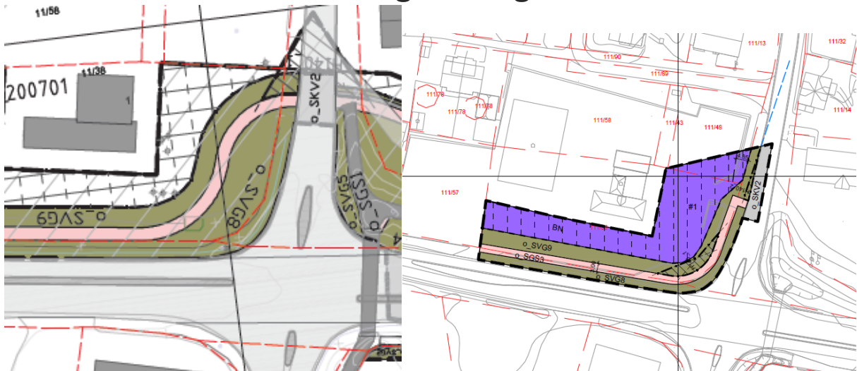
Figur 4: Utsnitt av gjeldende og forslag til nytt plankart.