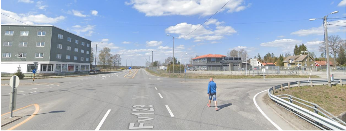
Figur 3: Utsnitt fra Google Street View i Slitukrysset. Planlagt gang- og sykkelvei skal ligge på høyre side av fylkesveien etter krysset.

Endringsforslaget omfatter den delen av gang- og sykkelveien nærmest Slitukrysset. Området er i dag preget av et stort kryss og tilhørende sidearealer. Området består i hovedsak av store asfalterte arealer og noen grønne sidearealer.