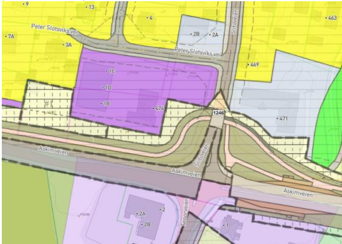
Figur 2: Utsnitt fra Indre Østfold kommunes planportal.

Gang- og sykkelveien er omfattet av reguleringsplan for Fv. 128 Gang- og sykkelvei, Slitu-Sekkelsten (PlanID 012520140002), vedtatt 2016.