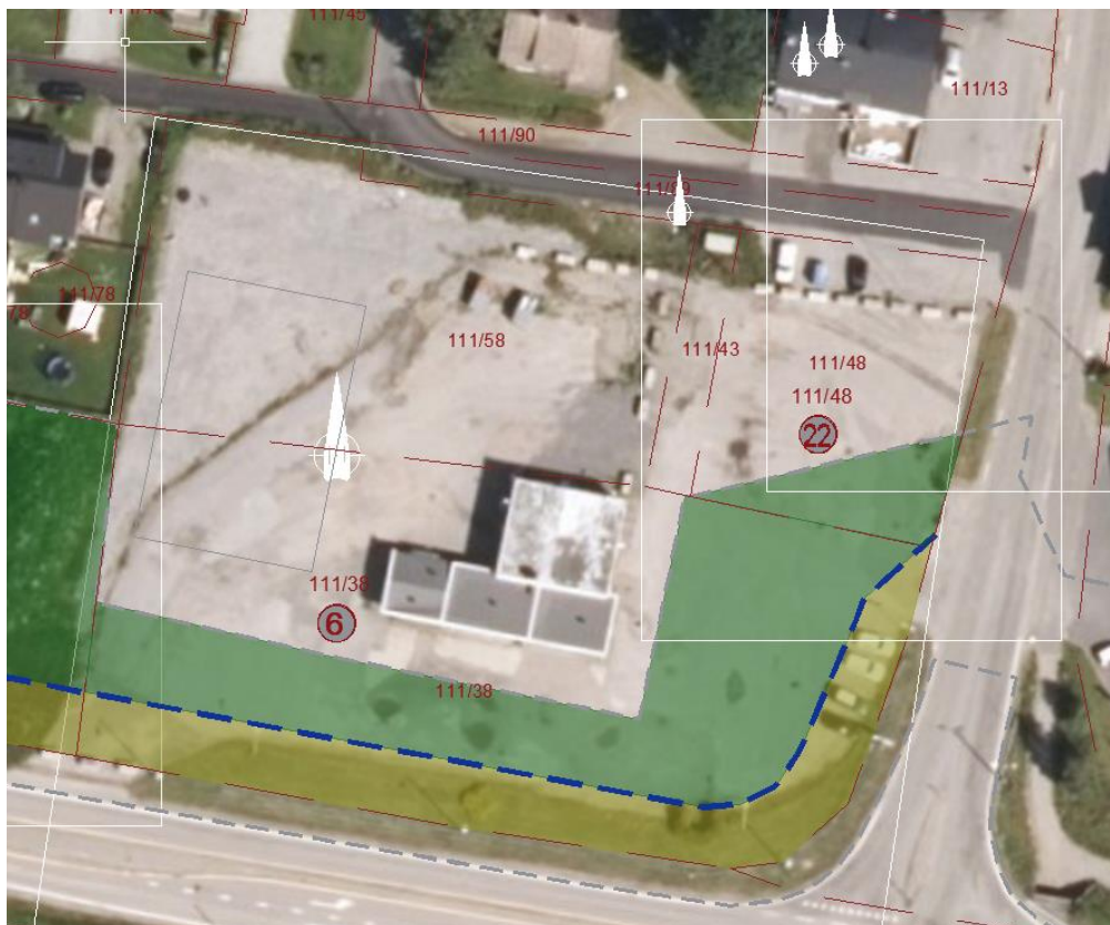
Figur 5: Utsnitt fra grunnervervstegningene som viser midlertidig (grønt) og permanent (gult) erverv på OL-monterings eiendommer.

Foreslått løsning vil redusere arealbeslaget på næringseiendommene 111/38 og 111/48 i forhold til gjeldende regulering. Dette vil være en gunstigere løsning for OL-montering som eier de to eiendommene, samt for Statens vegvesen med tanke på lavere kostnader for grunnerverv.