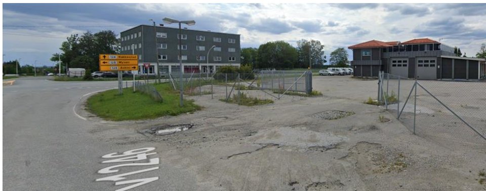
Figur 6: Utsnitt fra Google Street View som viser porten som kommer i konflikt med gang- og sykkelveien.

Flytting av avkjørsel har etter diskusjon mellom Statens vegvesen, Indre Østfold kommune og Østfold fylkeskommune blitt behandlet som avkjørselssøknad, og ikke som en del av denne planendringen. Søknad om flytting av avkjørsel ble sendt til Østfold fylkeskommune den 3. mai 2024 og vedtak om flytting ble gitt 12. juni 2024.